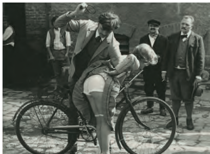
Une Blonde émoustillante