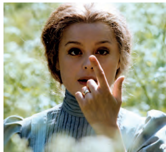
Une Blonde émoustillante