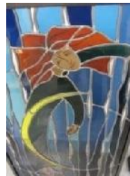
PEINTRE. FRESQUISTE. VITRAIL

D'après l'artiste elle a besoin d'un espace de sérénité. Raffinement, préciosité, subtilité lors du silence