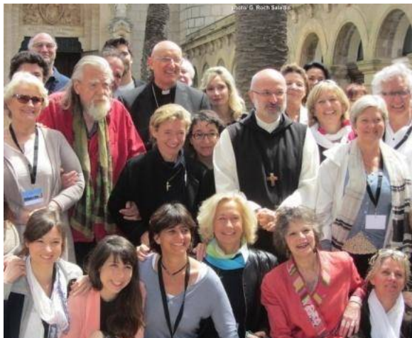
e 21 mai 2015

Du 19 mai au 22 mai a eu lieu une session d'artistes à l'Abbaye de Lérins, sur le thème : L'Artiste et la voix