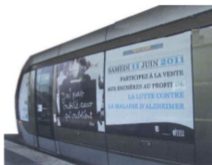
2 E TRAM PAR BEN

En 2011 pour la campagne au bénéfice de la lutte contre la maladie d'Alzheimer, BEN a eu la gentillesse de se prêter au jeu en livrant un pelliculage issu d'œuvres créées à cette l'occasion communiquant sur cette maladie.