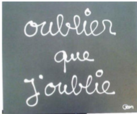
TABLEAU OFFERT PAR BEN EN 2011

En outre il a offert une de ces œuvres originales à la vente.