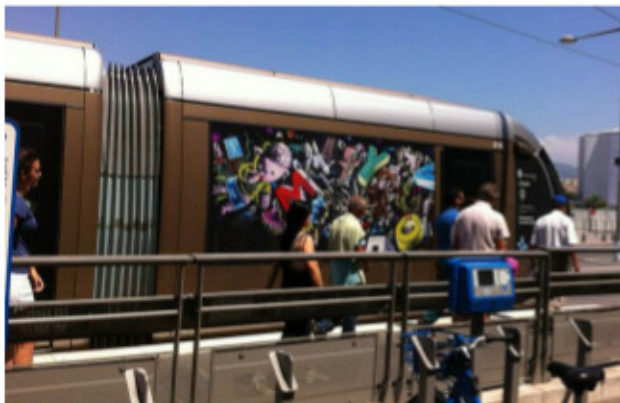
COMMUNICATION DE MOYA SUR LE TRAM EN 2012

En 2012 et 2013 c'est MOYA qui s'est livré au jeu en décorant le tram de ses facétieux personnages.