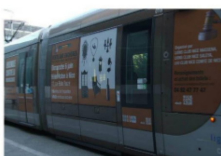
1 ER TRAM COMMUNICATION VILLE DE NICE

Si la première année la composition plastique a été confiée au service de communication de la Ville de Nice, il est apparu bien vite qu'offrir cet espace de création à un artiste pouvait créer une synergie entre un créateur et le bénéficiaire de l'œuvre.