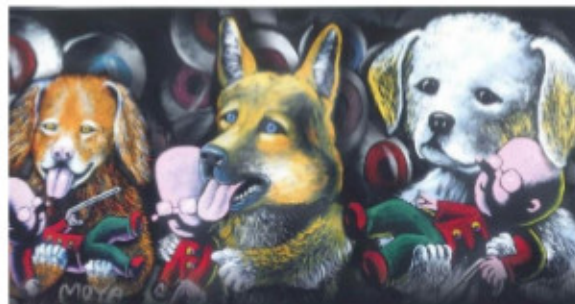
MOYA (Chiens d'Aveugles 2013)

Il conviendra bien sûr de définir choix suivant vos contraintes, certaines données :